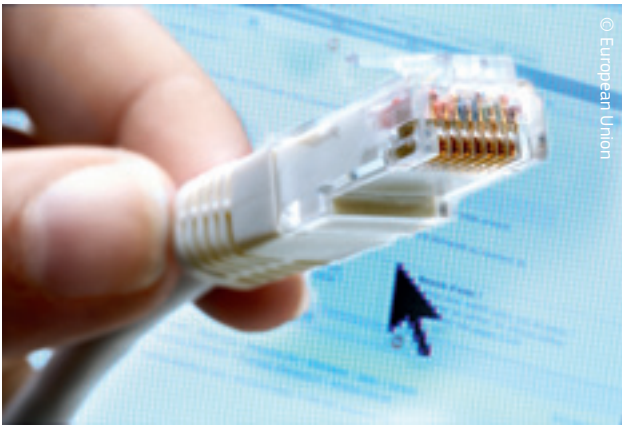
Švako kućanstvo i poduzeće u Europi imat će pristup internetu velike brzine.