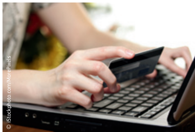
Digitalnom agendom za Europu nude se praktična rješenja za sigurnije pristupanje internetu.

Visoka razina mrežne i informacijske sigurnosti u cijelom EU-u važna je za osiguranje povjerenja potrošača i održanje internetskoga gospodarstva. Najvažniji element za to je uspostavljanje Strategije kibernetičke sigurnosti za Europsku uniju i prijedlog Komisije za direktivu o mrežnoj i informacijskoj sigurnosti. Oboje uključuje pravne mjere i poticaje kako bi se internetsko okružje EU-a učinilo najsigurnijim na svijetu.