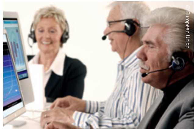
Digitalna agenda za Europu učinit će digitalnu tehnologiju dostupnom svima.

Vrhunska svjetska infrastruktura i odgovarajuće financiranje potrebni su za privlačenje najboljih europskih istraživača. Najbolje istraživačke ideje moraju