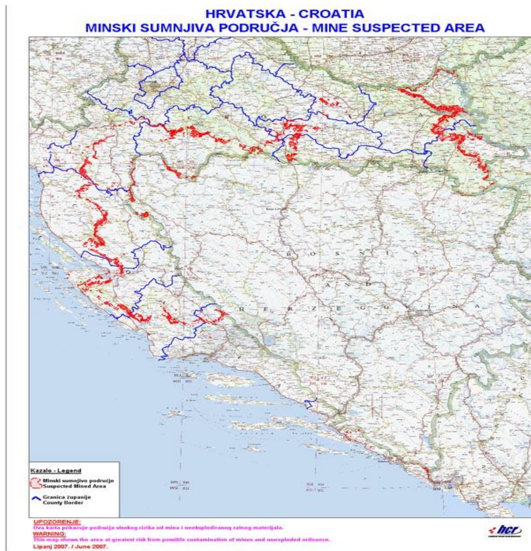
Slika 2: Minski sumnjiva područja u RH